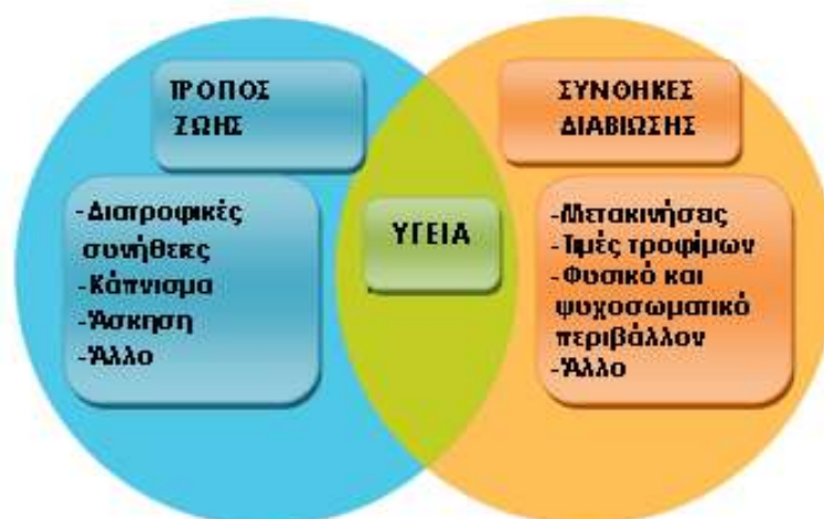
Εικόνα 1. Παράγοντες Υγείας: τρόπος ζωής και συνθήκες διαβίωσης.

Μια ευρεία έννοια για την υγεία εμπεριέχει τόσο τη σημασία του τρόπου ζωής όσο και των συνθηκών ζωής (Simonaska et al, 2006). Τρόπος ζωής (life style) είναι ο τρόπος που ζουν οι άνθρωποι, οι συνήθειες τους, οι επιλογές που κάνουν σε σχέση με την υγεία, συμπεριλαμβανομένων των επιλογών που έχουν σχέση με το φαγητό, τη φυσική άσκηση, την σεξουαλική συμπεριφορά, την χρήση καπνού, την χρήση ουσιών κτλ. Συνήθως τα άτομα έχουν την δυνατότητα να επηρεάσουν τις επιλογές που έχουν κάνει στον τρόπο ζωής τους.