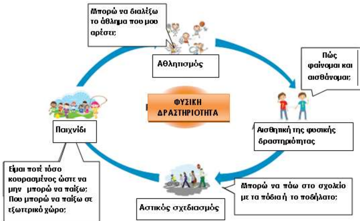
Εικόνα 3. Συνθήκες φυσικής δραστηριότητας (τροποποιημένο από Simovska et al, 2006).

Οι πέντε βασικές αξίες του δικτύου Σχολεία για την Υγεία στην Ευρώπη (SHE) είναι οι εξής: